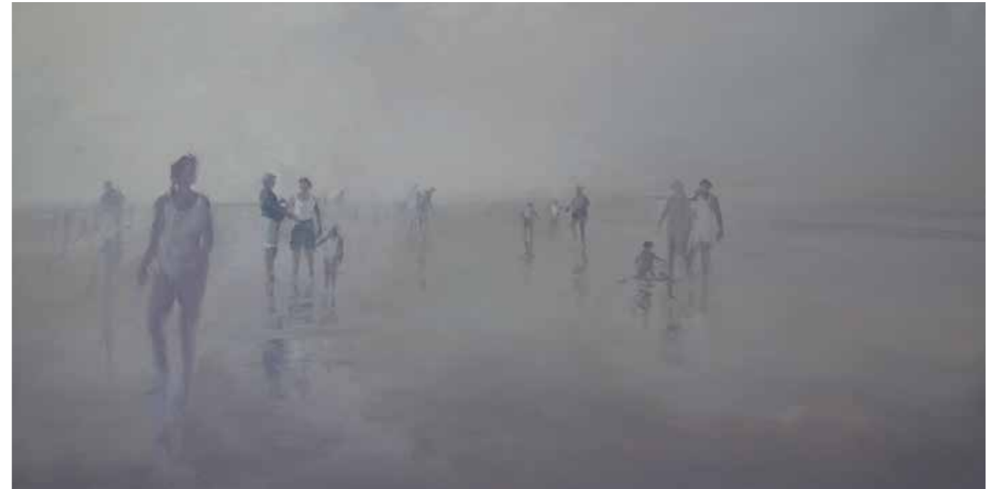
58/14 Am Strand 2014 | 50 x 100 cm | Öl auf Leinwand