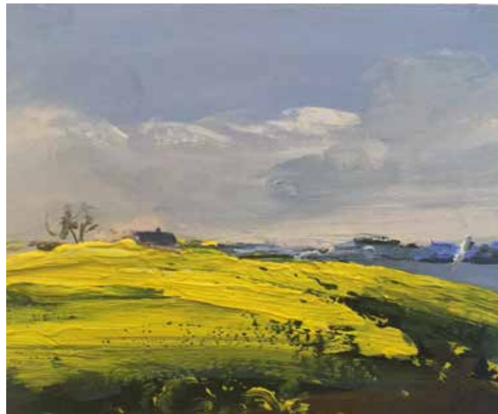
04/15 Raps Schlei 2015 | 15 x 12 cm | Öl auf Malpappe