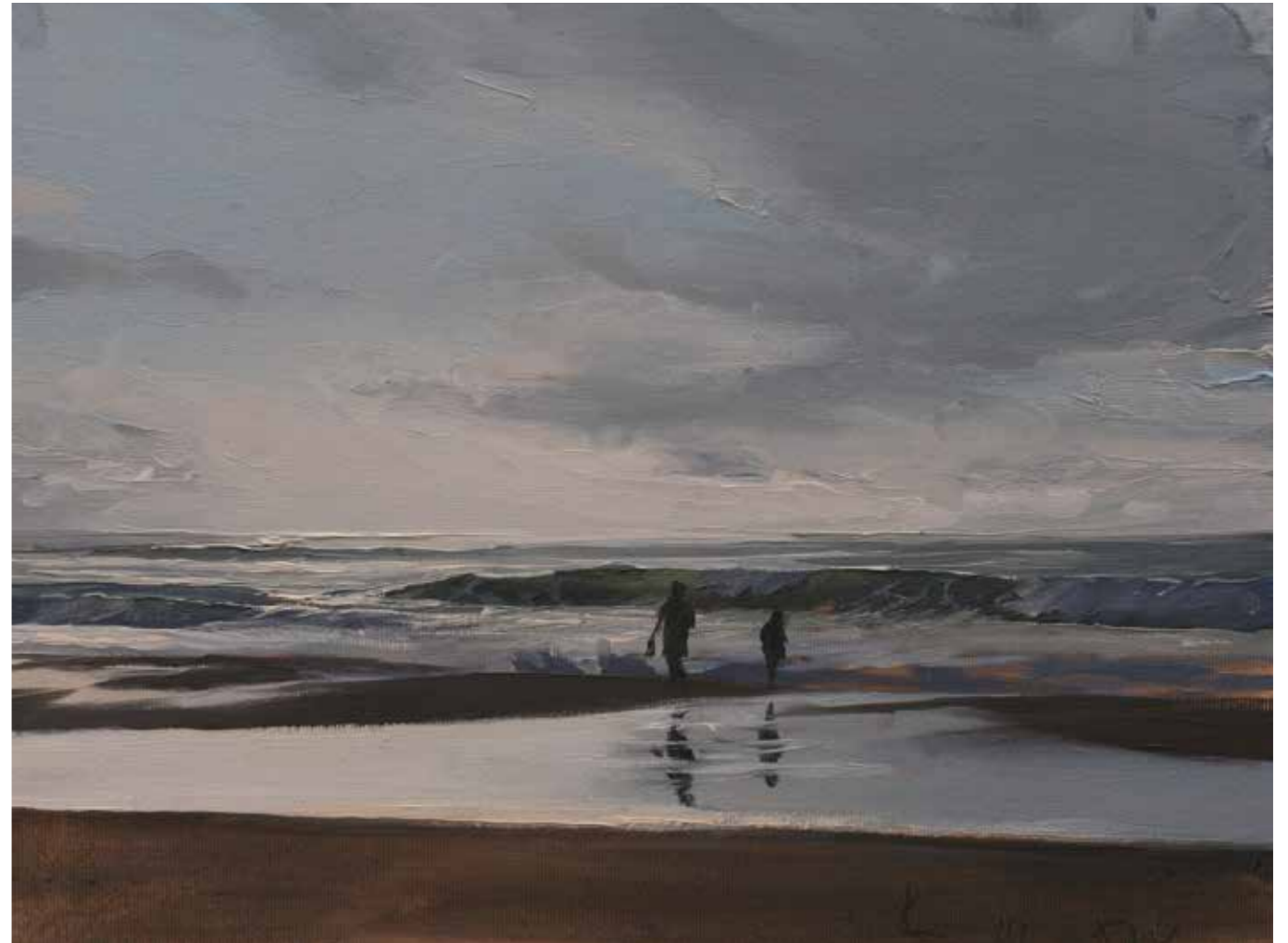
Abendspaziergang 30 x 40 cm | Acryl auf Karton