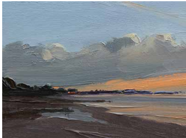
27/13 Bewölkter Tag 2013 | 30 x 40 cm | Öl auf Leinwand