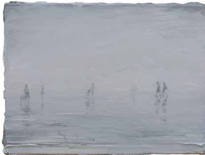
Figuren, Nebel 30 x 40 cm | Acryl auf Karton