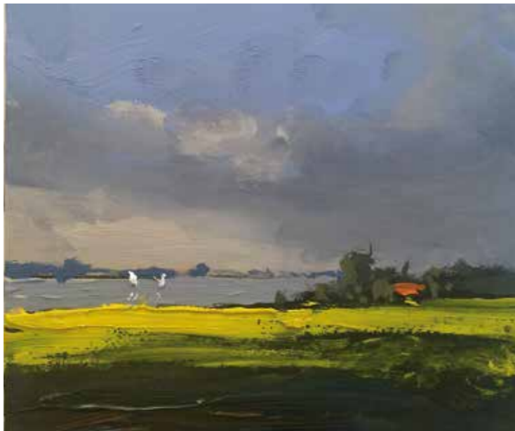
02/15 Raps-Schlei 2015 | 15 x 12 cm | Öl auf Malpappe