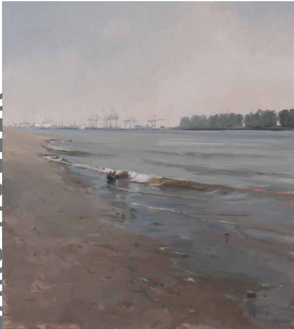
Die Elbe beim Hindenburgpark 90 x 80 cm | Acryl auf Malpappe