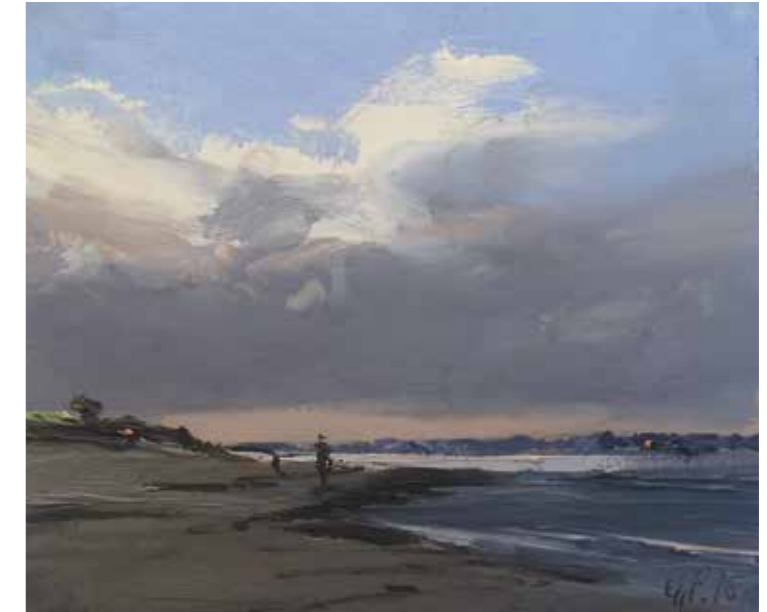
05/15 Kronsgaard 2015 | 15 x 12 cm | Öl auf Malpappe