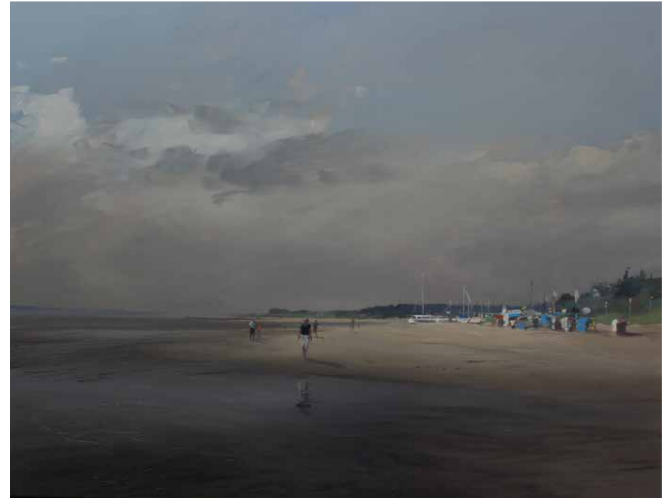
135/14 Südstrand - Föhr 2014 | 70 x 90 cm | Öl auf Leinwand