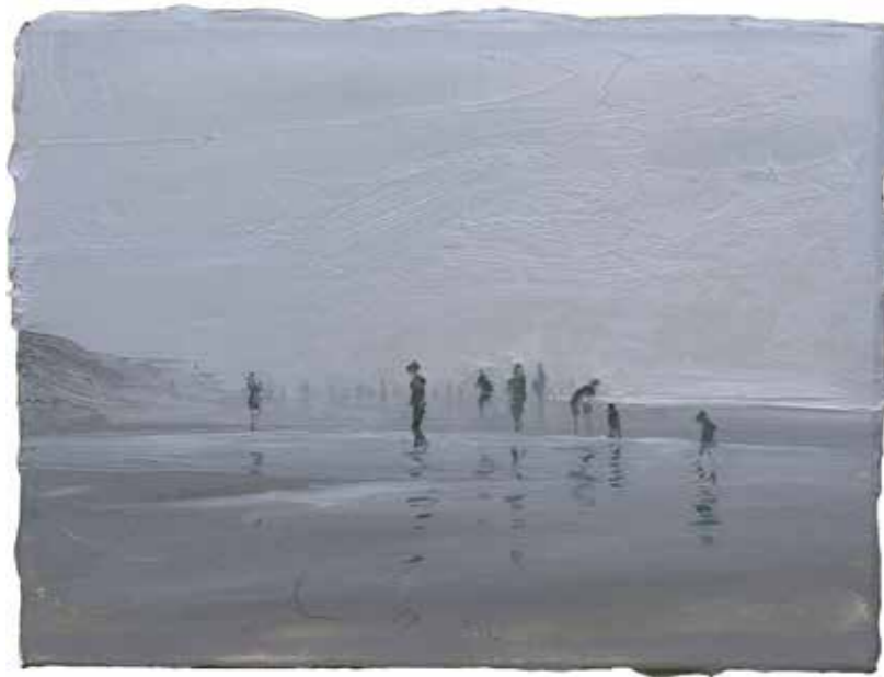
Strandleben, diesig 30 x 40 cm | Acryl auf Karton