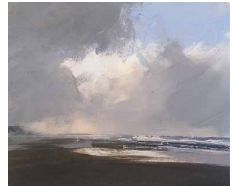
06/15 Sylt-Studie 2015 | 15 x 12 cm | Öl auf Malpappe