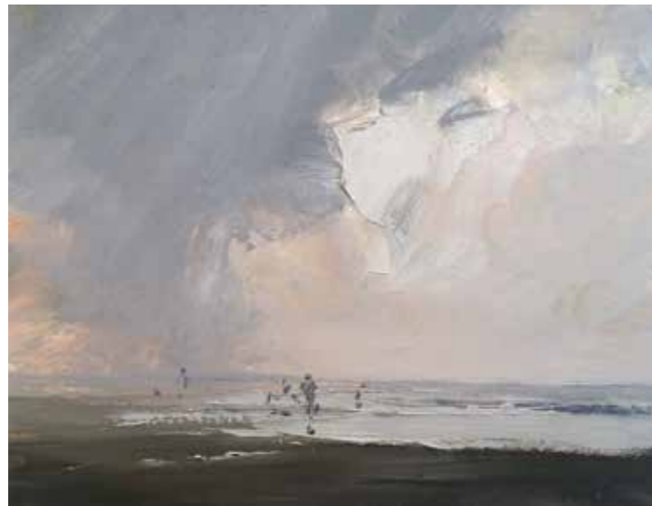
07/15 Abziehender Regen 2015 | 15 x 12 cm | Öl auf Malpappe