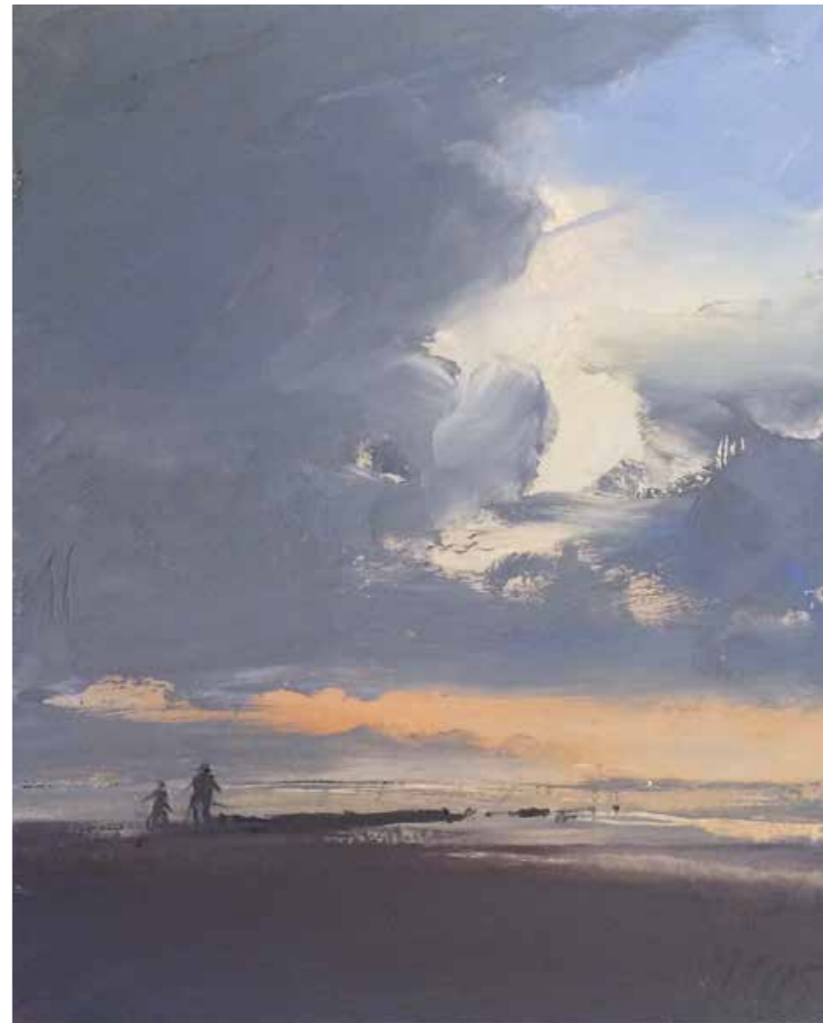
15/15 Sylt gegen Abend 2015 | 12 x 15 cm | Öl auf Malpappe