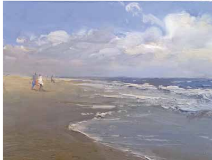
09/15 Sylt 2015 | 15 x 12 cm | Öl auf Malpappe