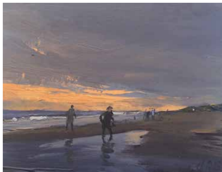
08/15 Abend - Sylt 2015 | 15 x 12 cm | Öl auf Malpappe