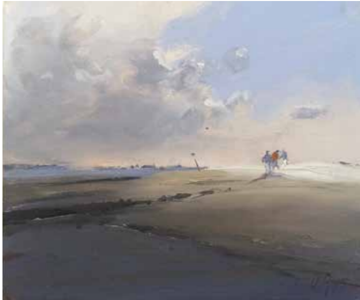
11/15 Föhr 2015 | 15 x 12 cm | Öl auf Malpappe