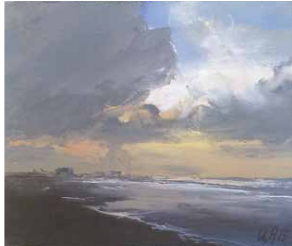
12/15 St. Peter Ording 2015 | 15 x 12 cm | Öl auf Malpappe