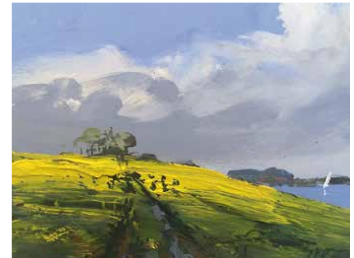
Ulf Petermann | 01/15 Raps Schlei

Für das Bildverständnis ist dies jedoch nicht wichtig. Es geht darum, das Wesen des Nordens zu erfassen und die Faszination dieser besonderen Naturlandschaft zu